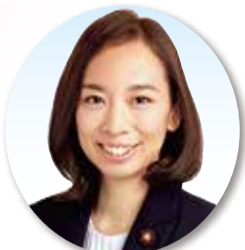
参議院議員・東京選挙区 吉良よし子