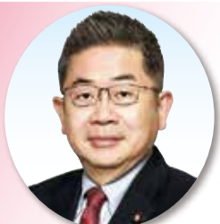
参議院議員・比例区 党書記局長 小池 晃